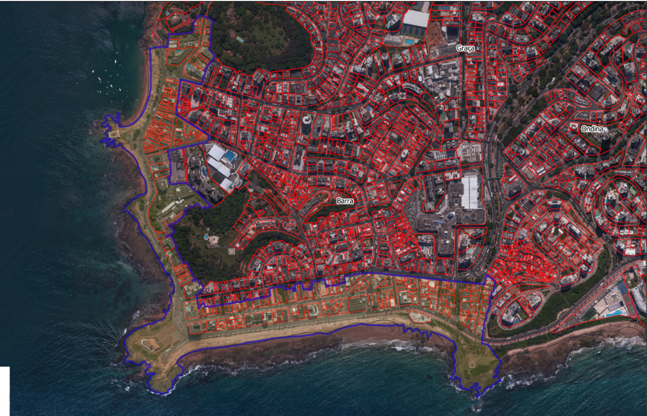
Poligonal 01: delimitada conforme Anexo IV deste edital, englobando parte do bairro da Barra